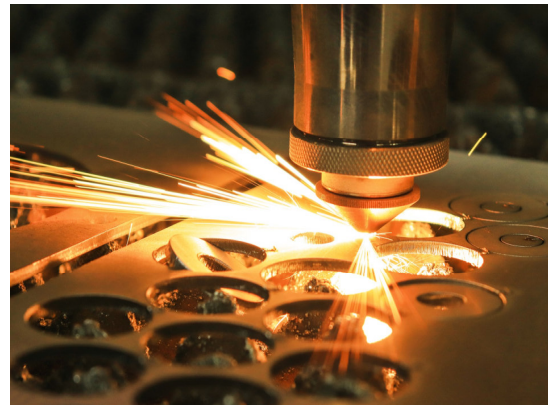
Laserschneiden mit einer CNC-Maschine

Du bist sowohl in der Planung als auch in der Durchführung und der Kontrolle tätig oder montierst und demontierst komplexe Anlagen. Auch die Programmierung, Prüfung und Inbetriebnahme sowie die Wartung und Instandsetzung von Anlagen gehören zu Deinen Aufgaben. Hierbei hast Du oft Kontakt mit Kunden.