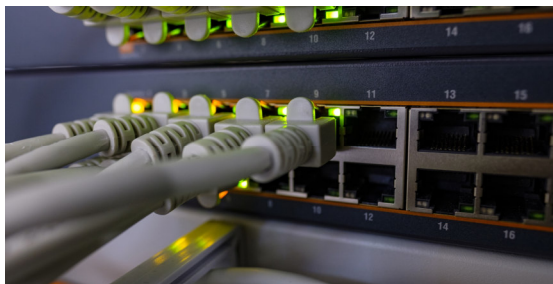
sowie der Informationstechnik.

Du bist sowohl in der Planung als auch in der Durchführung und der Kontrolle tätig oder montierst und demontierst komplexe Anlagen. Auch die Programmierung, Prüfung und Inbetriebnahme sowie die Wartung und Instandsetzung von Anlagen gehören zu Deinen Aufgaben. Hierbei hast Du oft Kontakt mit Kunden.