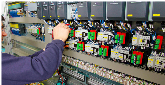
Elektrotechnik, Steuern und Regeln