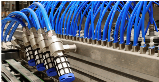
Metalltechnik, Hydraulik, Pneumatik,

Als Mechatroniker befasst Du Dich daher mit den folgenden Technologiefeldern: